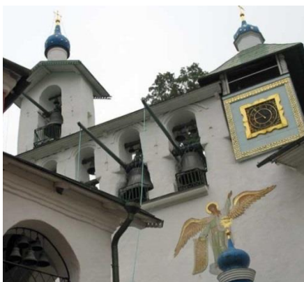
Рис. 1. Колокола с очепами