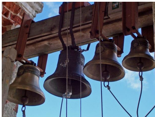
Рис. 2. Язычный колокольный звон

Схемы обозначают словом «Схема» и нумеруют последовательно арабскими цифрами в пределах всей работы, например: