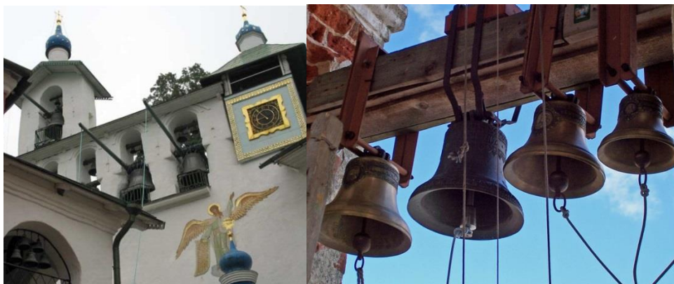
Рис. 1. Колокола с очепами