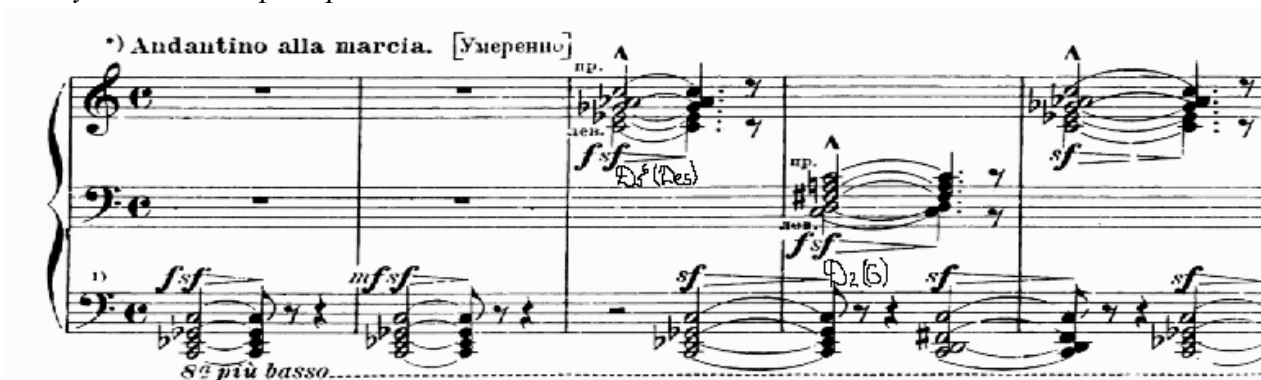
Музыкальный пример № 9

Все иллюстрации (схемы, репродукции, фотоснимки) в работах называются рисунками.